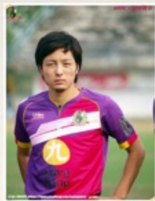
小針 優貴 プロサッカー選手 Nakhonnayok FC (タイ)