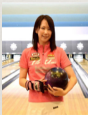
森 彩奈江 ボウリング プロ