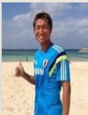
後藤 崇介 ビーチサッカー 日本代表