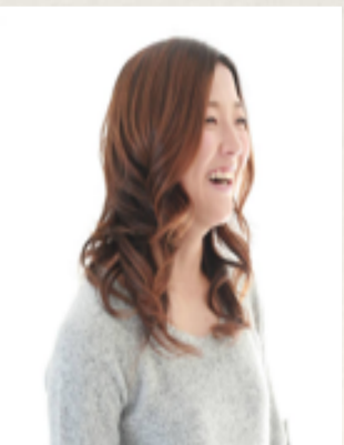
大儀見 優季 女子サッカー ヴォルフスブルグ