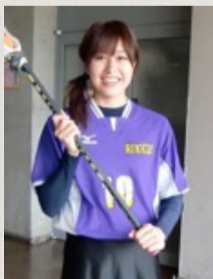
水戸 理恵 ラクロス 日本代表