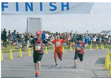
最後の力をふりしぼってゴール