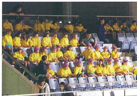
保育園児や小中学生も応援