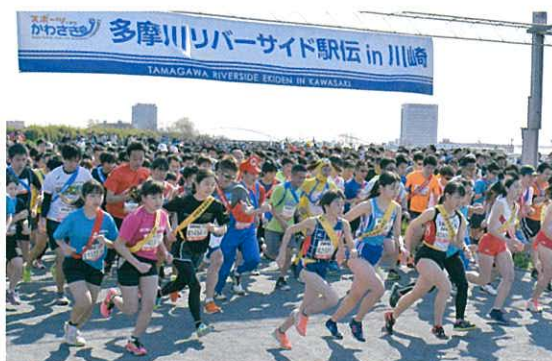
チームの期待を背負って一斉にスタート