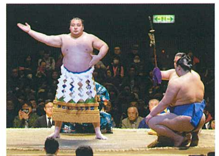
圧巻の横綱土俵入り