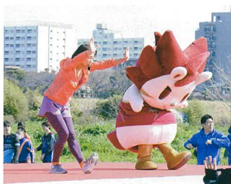
川崎ブレイブサンダースのロウル君も いっしょに準備運動