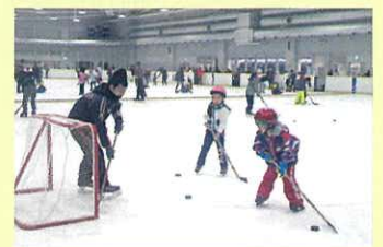
アイスホッケーを体験する小学生