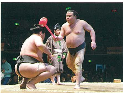
コトのような取組で笑いを誘う初切