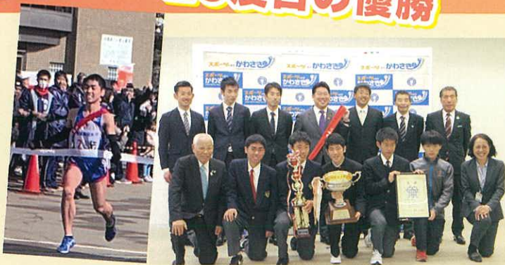
市長に優勝を報告する駅伝チームと関係者のみなさん