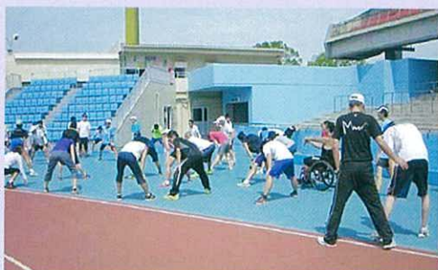
練習前に準備運動をするメンバー

現在会員は60名、スタッフ登録者は20名程で、月2回程度、等々力陸上競技場、サブグラウンドを主な練習場所として練習しています。短・中距離走、立・走り幅跳び、砲丸・ソフトボール・ビーンバッグ投げ、ジャベリックスロー、スラローム等の種目を、総じて選手に無理のない範囲で一日数種目を実施しています。この練習をもとに、川崎市障害者陸上大会、スポーツ教室の記録会への出場、多摩川リバーサイド駅伝、川崎国際多摩川マラソン、幸区マラソンへ参加し、レクリエーションとして年2回の日帰りバス旅行、クリスマス会を実施しています。記録会では、相模原市の陸上クラブの皆様の参加も得て、川崎市内の各養護学校・支援学校の選手の皆さんと共に、よきライバルとして切磋琢磨しています。