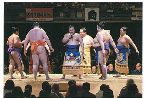
独特の節回りで歌い上げる相撲甚句