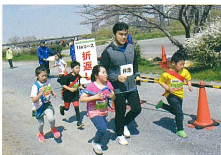
キッズ・ファミリーの部の選手たち