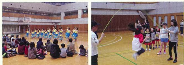
フラダンスを披露

発表の部では、ダブルダッチ・チアダンス・フラダンスに、大きな拍手と歓声が上がりました。後半の部で、ダブルダッチの体験とフリースロー・ミニバスケットボールを行いました。スタンプラリー形式で、すべてのコーナーを全部回ると参加賞がもらえるのでどの子も頑張っており、汗を流していました。短い時間でしたが、総勢350人の参加者がスポーツを楽しみふれあいを深めました。