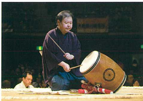
トントコトンと小気味よい櫓太鼓の音