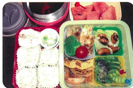
素麺のお弁当 松本妃奈 (野川中3年)