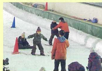
スノーボードのレッスン風景