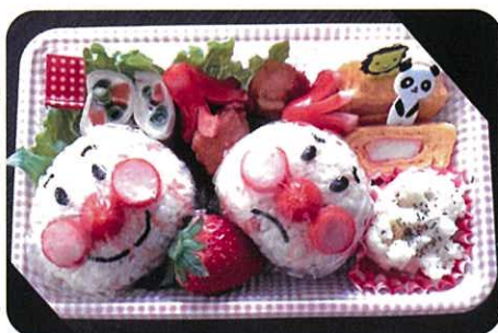
いっぱい食べて、 元気100倍 島田麻美 (宿河原小PTA)