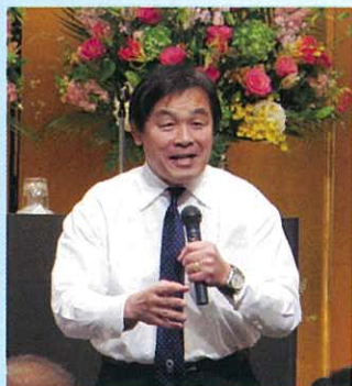
講師 衆議院議員 馳 浩氏

記念講演では、元文部科学大臣でオリンピックの馳浩氏を講師に迎え、これからのスポーツの方向性について講演をいただきました。