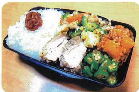
スポーツマンが夏バテ しないパワフル飯 岩本直也 (宮前平中3年)