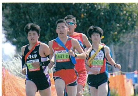
迫力あるロングの部の走り