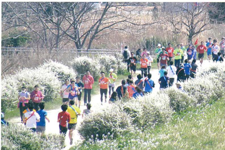
満開のユキヤナギのコース

特別ゲストチームとして、専修大学陸上競技部と國學院大學陸上競技部の選手がロングの部に、富士通アメリカンフットボール部「富士通フロンティアーズ」の選手がキッズ・ファミリーの部に参加しました。