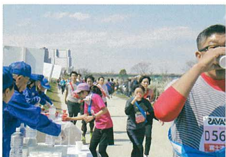
給水所も大にぎわい