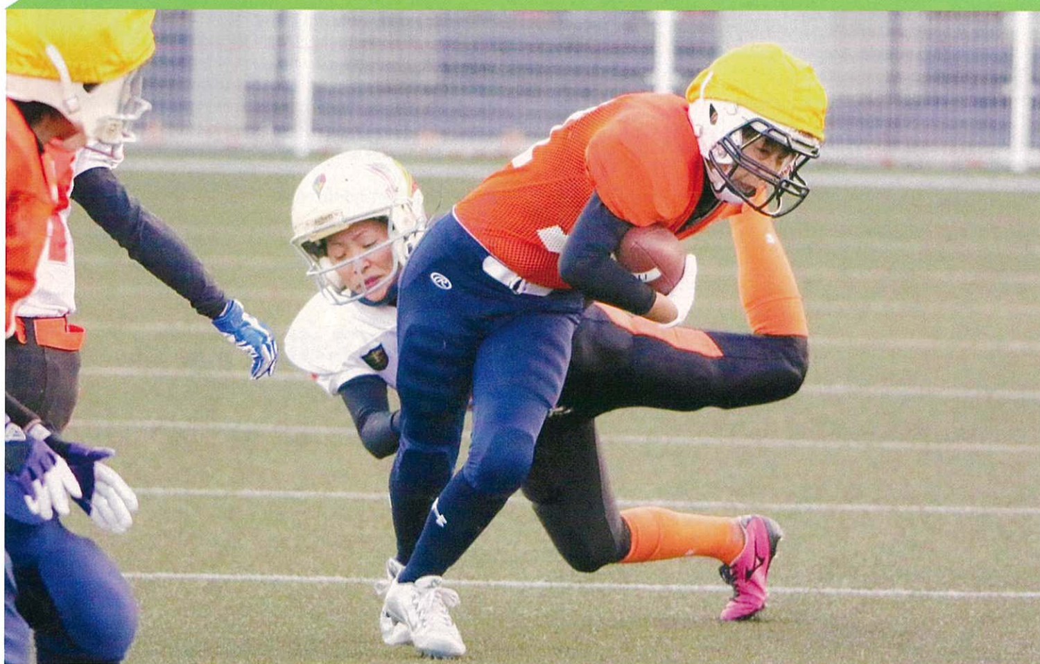
スポーツ写真コンテスト最優秀賞受賞作品