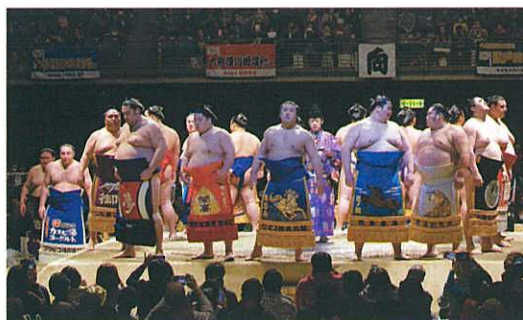
化粧まわしをつけた幕内力士が勢ぞろい