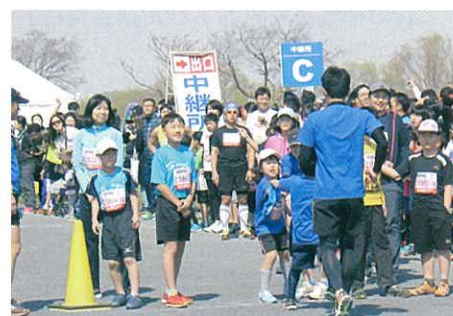
お父さんまだかな