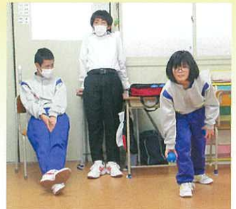
学校での練習の様子

今後も、今回学んだ「ルール・マナーを大切に」「自己の責任を果たそうとする」「集団に参加し協力する」という気持ちを持ち、授業の中にポッチャを取り入れていきたいと思っています。