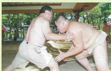
試合前、私（左）とぶつかり稽古（全中鹿児島大会）

川崎出身の友風関は、初土俵からわずか2年で幕内力士へ昇進し、今年7月の名古屋場所では殊勲賞を受賞。10月には2019年度川崎市アゼリア輝賞も受賞し今後の活躍が期待される力士です。その友風関が相撲をはじめたのは中学時代。当時を知る先生にエピソードをご寄稿いただきました。