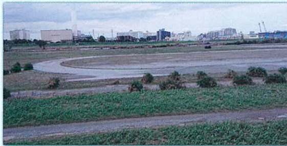
台風から10日後の古市場陸上競技場の様子です。全体には大分水が引きましたが、トラックの形で水がまだ残っています。