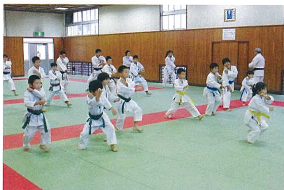
空手道の練習では、元気な声が聞こえます

また、「平日はなかなか来ることができなくて」と話された男性は、久しぶりの練習ということで全身汗まみれになりながら剣道に打ち込んでいました。