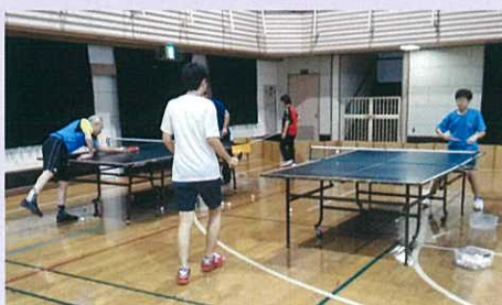
コーチがマンツーマンで指導

私たちつつじ卓球クラブは毎月第2・第4日曜日の9時から15時30分の間に川崎市リハビリテーション福祉センター体育館（中原区井田3-16-1）で練習しています。