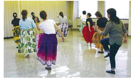
曲に合わせてストレッチや軽運動

この教室にははじめから参加されているという女性の方は、「初めて参加するときは少し緊張しましたが、先生もほかの皆さんもとても気さくでやさしいので毎回楽しく参加しています。フラダンスだけでなく、いろいろな運動ができるのがうれしいです」と話してくださいました。