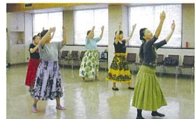
全員が理解するまでじっくりと練習をくり返します