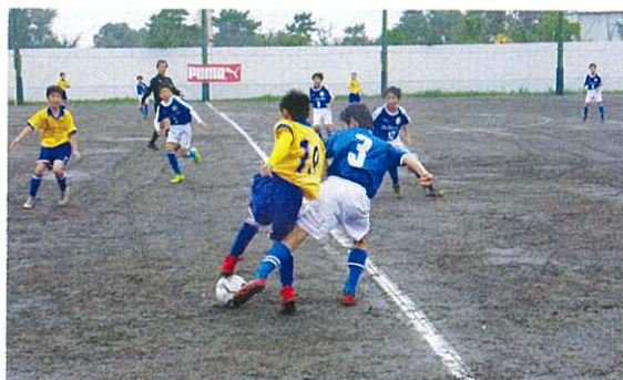
川崎市トレセンVS相模原トレセンの熱戦

この大会は、今年で31回を迎える歴史のある大会で、応援している保護者の中には、「小学生の時にこの大会に出ました」と、なつかしそうにお話をされる方もいました。