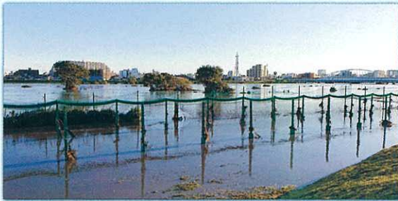
10月13日は台風一過の秋晴れでした。マラソンコース上の防球ネットの支柱が半分以上水没している状態でした。

また、2020年3月15日に予定されておりました「2020多摩川リバーサイド駅伝in川崎」も、中止とさせていただきます。ジョギング愛好者の日常の活動にも支障をきたしております。マラソンコースの一日も早い復旧がまたれます。