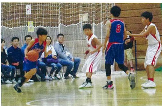
多くの保護者も応援していました

幸スポーツセンターは、幸区役所や市民館・図書館と同じ敷地内にある施設です。この日は、トレーニング室をはじめとしてバドミントン、卓球、パラスポーツなどが無料で体験できるということで、多くの利用者でにぎわっていました。