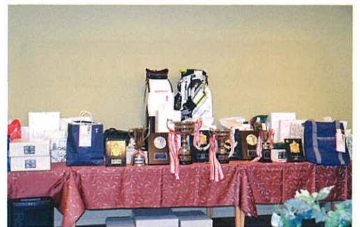
今年も豪華賞品がそろいました