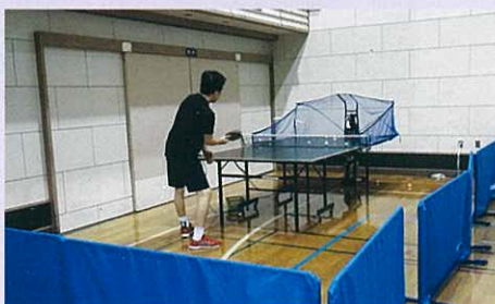
マシンを使っでの練習