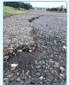
マラソンコースの様子は、舗装の剥離が多々見られました。