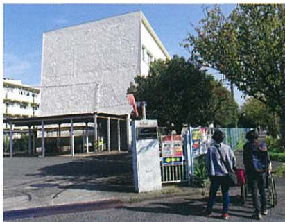
桜本センターの入り口