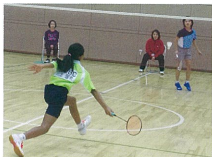
バドミントン交流大会