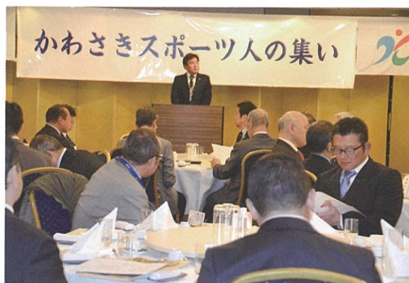
210人が出席した集い