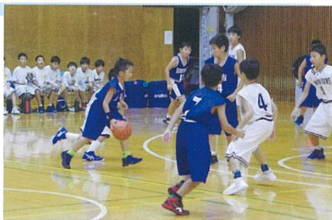
ミニバスケットボール交流大会

一つの種目だけを1年間行うことは、体力や技術面から良い効果は得られないといわれています。主となる種目と合わせて、違ったタイプの種目も体験できるような工夫が必要です。