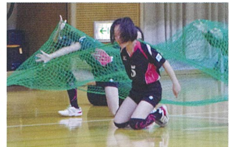
大人気のパン食い競争や障害物リレー