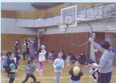
ミニバスケット教室 幼児コーナー

かわさきスポーツドリーマーズと中原元気クラブが、とどろきアリーナでスポーツフェスティバルを開催しました。体験として「走り方教室」と「ミニバスケット教室」をしました。「ミニバスケットボール」は幼児の参加者が多く賑わいました。発表の部では「キッズダンス」を披露し、観客から大きな拍手が送られました。総勢380人の参加者がスポーツを楽しみ、地域の方々とふれあいを深めることができました。