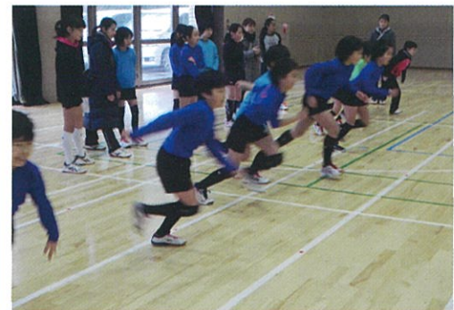
立ち幅跳び、上体起こし、50m走などの運動適性テストの様子