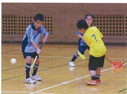
フロアボール交流大会