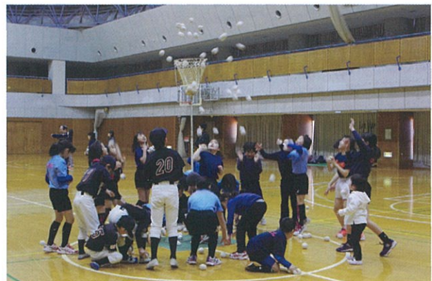
どの種目も実力伯仲で好勝負が見られます