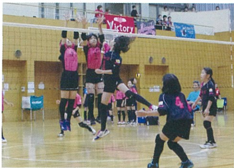
バレーボール交流大会

1962年、財団法人日本体育協会創立50周年記念事業として「一人でも多くの青少年にスポーツの喜びを」「スポーツを通じて青少年のからだところを育てる組織を地域社会の中に」と願い創設された日本最大の少年スポーツを統括する団体です。平成29年度の登録団体数は32,170団体、団員数は694,173人となっております。種目別にみると、軟式野球が圧倒的に多くサッカー、バレーボールと球技が続きます。その次に複合種目（年間に2つ以上の種目やレクリエーション活動などに取り組む）が多く、武道、陸上競技や体操、水泳など多岐にわたっているのもスポーツ少年団の特徴です。