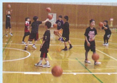
ミニバスケット教室 小学生コーナー