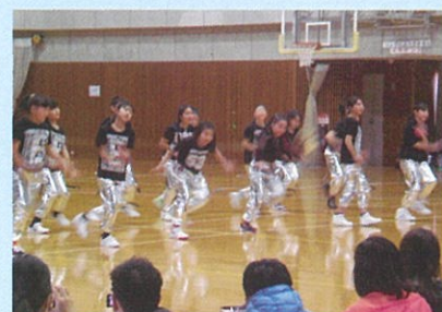
キッズダンスの発表