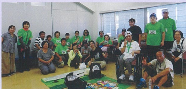
2019年全国障害者フライングディスク大会（駒沢競技場にて）

練習内容は、10時から11時までアキュラシー競技練習、それから5分から10分程度休憩し、その後ディスタンス競技練習をします。毎回楽しく技術向上を目指し練習しています。