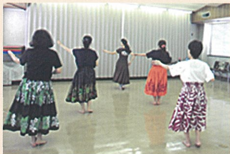
やさしいフラダンスの教室風景