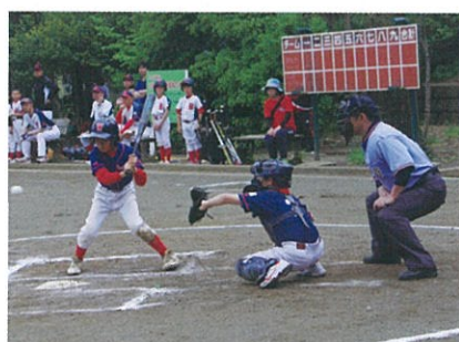
軟式野球交流大会