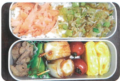
野菜が苦手な弟のために! 栄養満点弁当 古牧 絆 (玉川中学校2年)