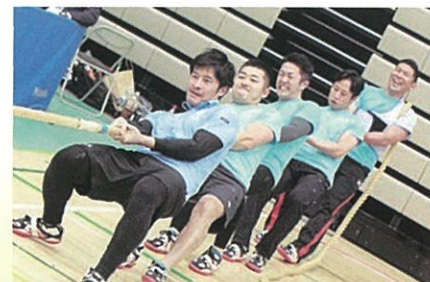
綱引きチャレンジ