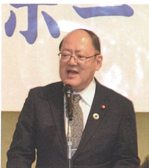
花輪孝一川崎市議会副議長