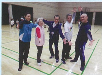
各クラブの運営スタッフ

川崎市北部では、柿生GET、中野島ビルネ、金程わ・わ・わクラブの3つの「総合型地域スポーツクラブ」と、初参加の地元麻生の「クラブコア」の4団体が協同して、麻生スポーツセンターを会場に「わくわくイベント2019」を開催しました。