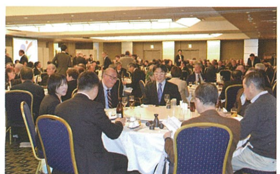
競技の粋を越え和やかに歓談する参加者