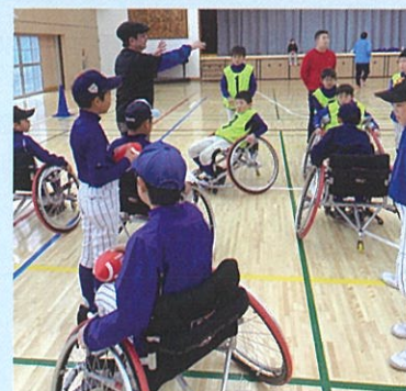
車いすアメフト体験

朝からあいにくの天気で参加者が減少しましたが、地元の少年野球チームが参加してくれたおかげで、何とか開催することができました。いつも使っている野球のボールとは違うボールではありましたが、順応性の高い子が多く、すぐに扱いに慣れ、指導者も驚いていました。将来が楽しみです。