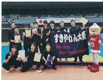
男子優勝チーム「好きやねん」