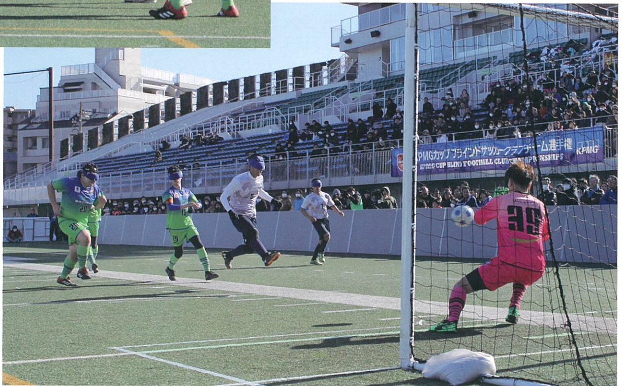
富士通スタジアム川崎で行われた「KPMGカップブラインドサッカークラブチーム選手権2020」