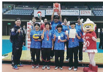
女子優勝チーム「DEAF ONE TEAM 2020」

優勝 DEAF ONE TEAM 2020（北海道） 準優勝 一期一会（兵庫県） 第3位 tortoise（大阪府）