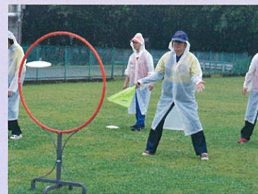
ディスクを投げて輪を通過させる「アキュラシー」種目

主な活動は、川崎市障害者スポーツ大会の参加と、全国障害者フライングディスク大会の参加、神奈川県障害者フライングディスク大会の参加です。