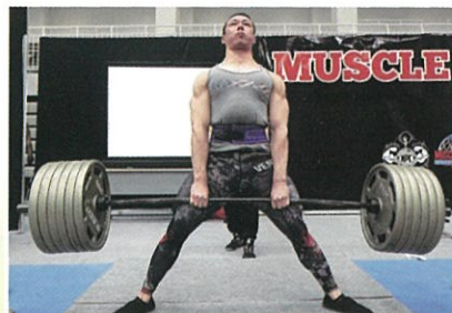
パワーコンテスト