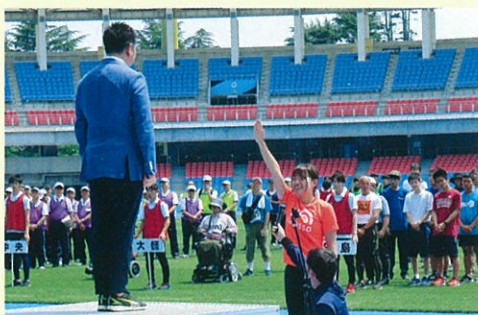
川崎市障害者スポーツ大会 陸上大会 開会式の様子