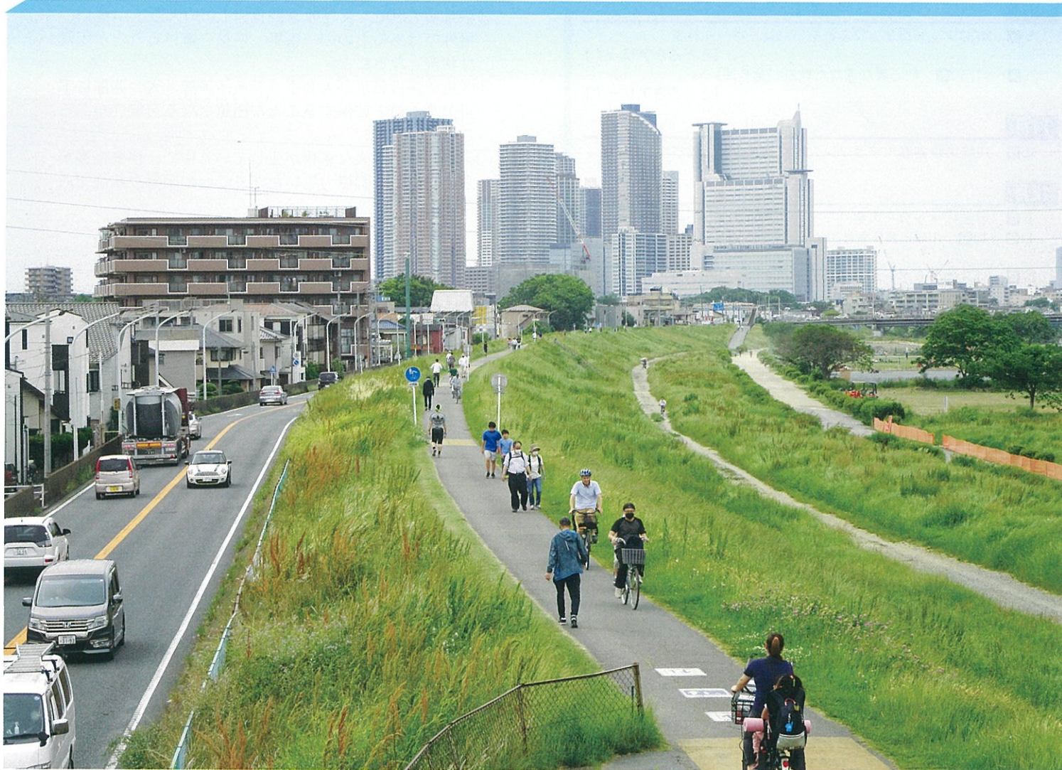
緊急事態宣言発令中の5月初旬、多摩川土手を歩く人々（古市場歩道橋より撮影）