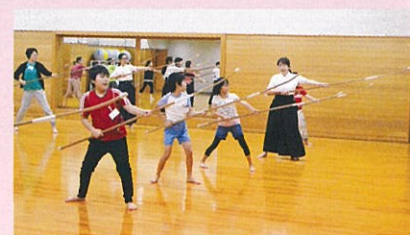
なぎなたの基本の構えを学びます

※新型コロナウイルス感染拡大の影響で、教室が中止・変更になる場合があります。あらかじめご了承ください。その際は当協会ホームページでお知らせします。