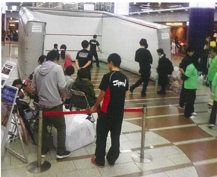
川崎アゼリアでのエアースカッシュ体験イベント

世界的に著名な雑誌が、様々なスポーツを対象とした研究の結果、スカッシュは“世界一健康的なスポーツ”と書いています。1時間の消費エネルギーは、通常のプレーヤーで700kcal前後、プロ選手で1,500kcalと、他のスポーツに比べて短時間で十分な運動効果が得られます。