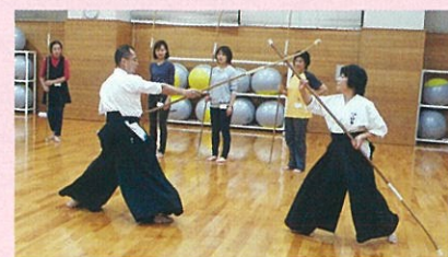
なぎなた連盟会員の模範演技