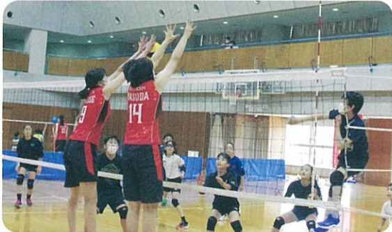
見事なスパイク 見事なブロック