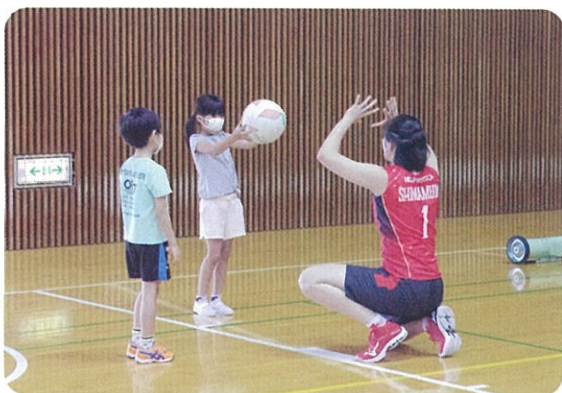
初めてバレーボールを経験する子が何人もいました