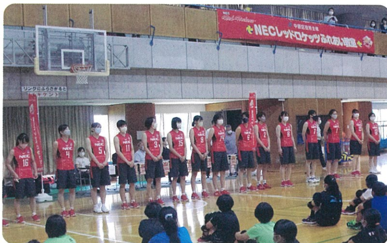
NECレッドロケッツの選手全員が集まりました

経験者グループは、選手が見本をみせながらポイントを説明し、後半は試合さながらの白熱したゲームを行いました。