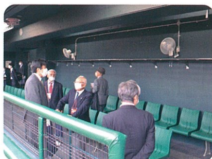
35席のダッグアウト