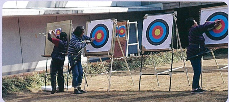
点数を確認した後に的から矢取りをしています