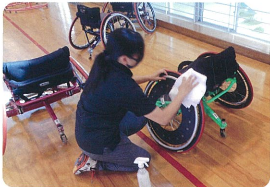
始まる前に全ての道具を丁寧に消毒しました

今年度は、新型コロナウイルスの影響でしばらく実施を見合わせていましたが、9月29日、麻生区の東柿生小学校からスタートしました。この日は、4年生2クラス62人が3～4時間目の90分を使って車いすバスケットボールを体験しました。