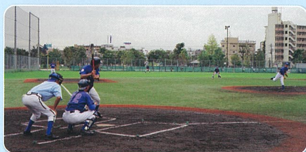
紅白戦のゲーム中の様子