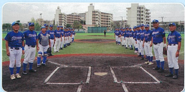
試合開始前のあいさつ 左が75歳以上の紅組 右は70～74歳の白組

川崎ブルーソックスは、2度の全国優勝だけでなく、川崎市が推進する「高齢者のスポーツ推進と運動による健康づくり」を象徴するスポーツチームで、健康づくりや生涯スポーツに取り組む多くの市民の励みとなっていることから、スポーツ賞の受賞となりました。