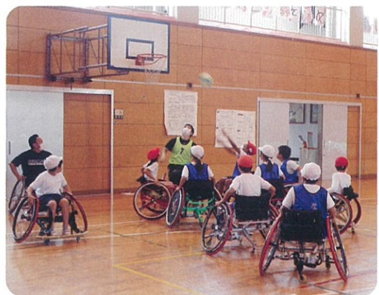
ミニゲームでナイスシュート

最後は、児童たちによるミニゲームの試合体験です。児童の中に講師が加わって試合をしましたが、全員が体験を通して教わった事を実践し、精一杯ゲームに取り組んでいました。試合は白熱したものとなり、シュートが決まると応援している児童も一緒になって盛り上がり楽しそうでした。