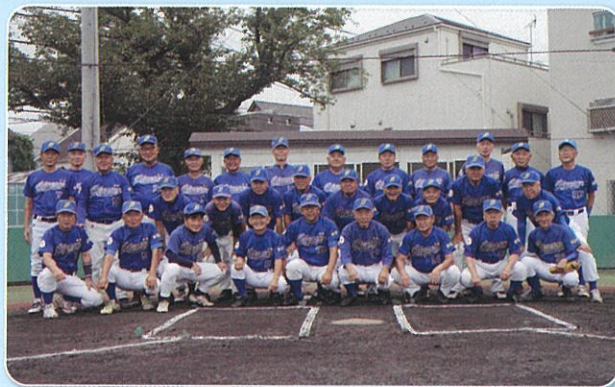
10月の練習（紅白戦）には、35人の部員のうち30人が参加しました。

川崎市内を活動拠点とする古希軟式野球チーム「川崎ブルーソックス」が令和2年度（第49回）川崎市スポーツ賞を受賞しました。