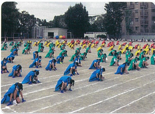
平日に児童だけで開催した運動会

学校再開後、3密を避け、体育学習を進めるために、指導計画の順番を入れ替えたり、行い方を工夫したりすることで、少しずつではありますが、子どもたちも運動することの楽しさを味わうことができるようになってきました。小学校では春に予定されていた「運動会」を秋に移し、その取組について検討を重ねてきました。学校によっては「運動会」という名称を工夫し、「〇〇小オリンピック2020」として、次年度に延期となったオリンピック・パラリンピックを今年度、子どもたちの想いを込めて創りあげ、次年度にその盛り上がりをつなげていこうとする取組もあります。