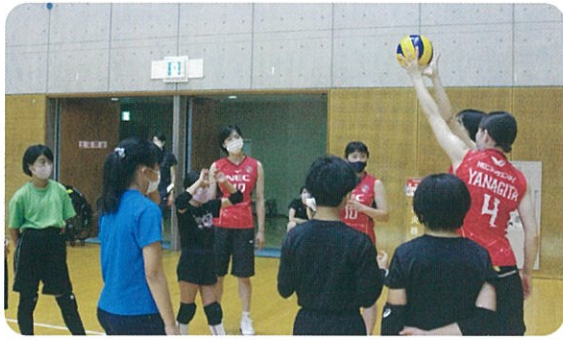
熱心に説明を聞く子どもたち