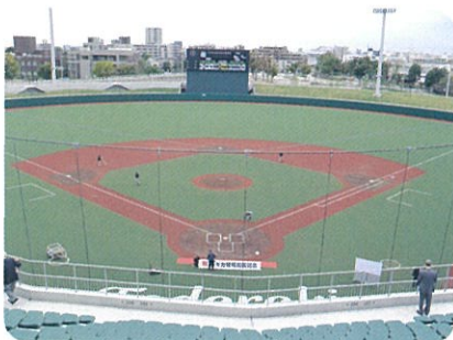
3階席からみた球場全景

式典終了後は内覧会があり、ダッグアウト、選手ロッカーや屋内野球練習場、外野席下に設けられた交流施設「等々力老人いこいの家」などを見学しました。球場は防災備蓄倉庫の整備など、災害時の活動拠点としての機能も導入しています。また、公園内の野球場として親しまれるよう、遊歩道デッキを設けており、自由に散策ができます。