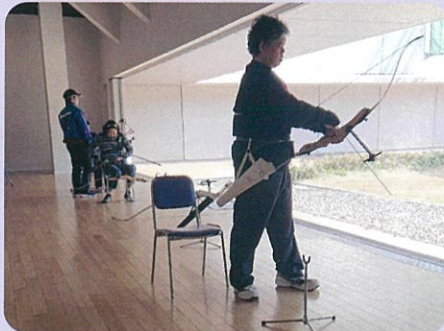
自分の射影を確認して次の射動作にはいる