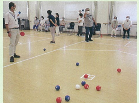
老人福祉センターでの体験会の様子

今後も市民のみなさんが、身近な地域でボッチャを楽しめるよう環境づくりを進めていくとともに、障害者スポーツの更なる機会の拡充と障害者スポーツに対する理解の促進を図ることで共生社会の実現を目指していきます。