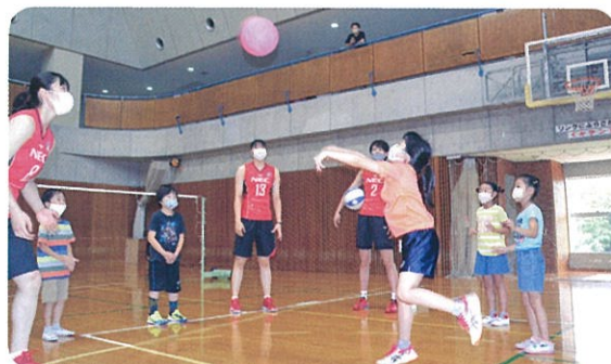
初心者グループはボールを落とさずに10回つなくゲーム