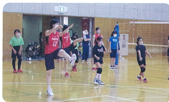
準備運動から楽しそう みんな張り切っています