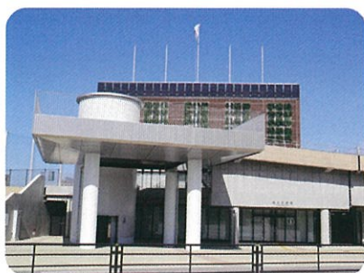
1階 インフォメーションセンター