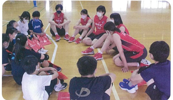
終わった後は、選手への質問コーナー

参加した小学生や保護者の方からメールで多数の感想が寄せられました。その中の一部を掲載します。