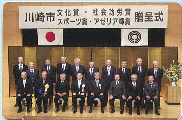
10月29日に行われた贈呈式に出席