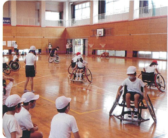
初めての車いすはなかなか思い通りにいきません

続いて、学校の先生方と講師によるデモンストレーションの体験試合を行いました。おとなでも車いすの操作に手間取り、座ったままシュートを打つのが難しそうでした。その後、児童たちが実際に競技用車いすに乗って移動や停止の仕方を教えてもらい、まっすぐ走る練習をしました。はじめは扱いに戸惑うまく動かし事ができなかった子どもたちですが、講師のアドバイスを受けながら繰り返すうちにどんどん上達していきました。リングゴールを使ってのシュート練習では、簡単にシュートを決める子、なかなか決められない子など様々でしたが、どの子も目を輝かせながらシュートする姿が印象的でした。