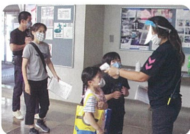
始める前には入念に健康チェックをしました