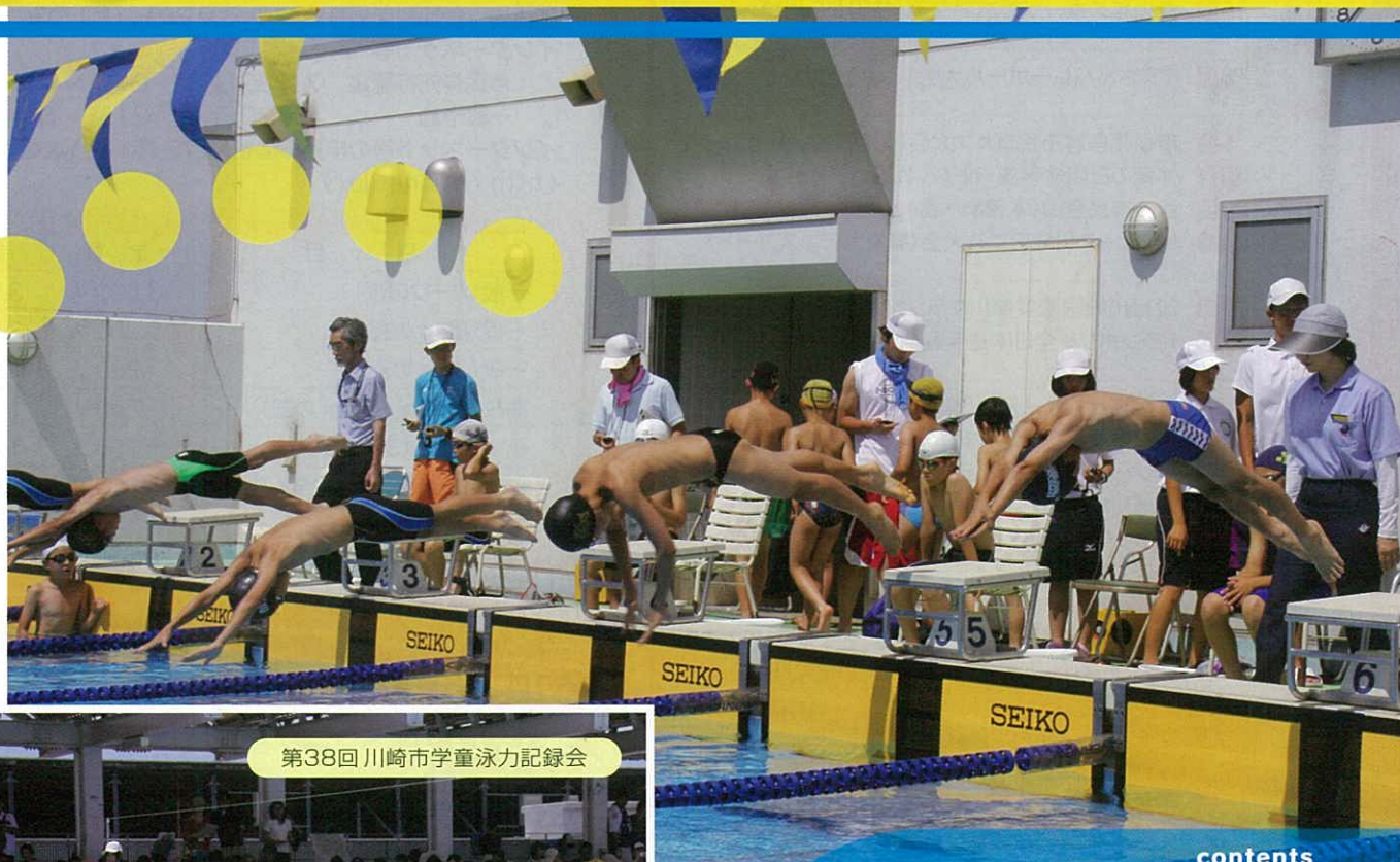
第38回川崎市学童泳力記録会