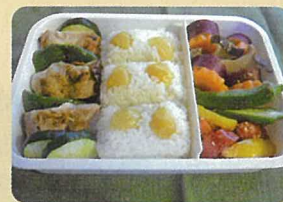
五十嵐 冬眞 「がっつり男子弁当 秋バージョン」