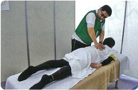
川崎市鍼灸マッサージ師会によるマッサージボランティア 駅伝で疲れた体を癒してもらうランナーで大盛況でした