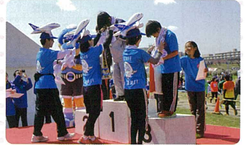
島根県益田市からタオルが贈られました