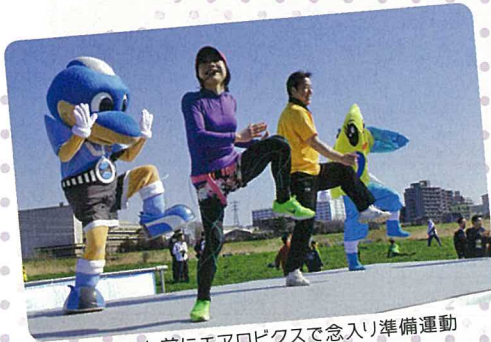
スタート前にエアロピクスで念入り準備運動