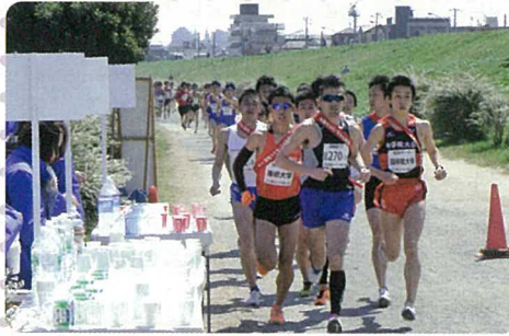
給水所に差し掛かる先頭集団