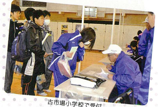
古市場小学校で受付