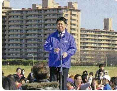
開会式 福田紀彦大会会長(川崎市長)より開会のご挨拶