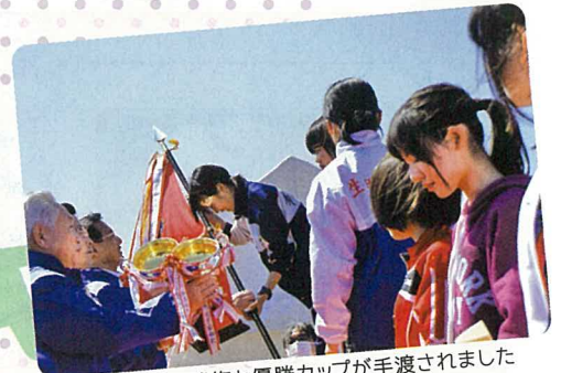
表彰式：優勝旗と優勝カップが手渡されました