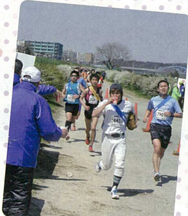
ランナーのために給水を補助するボランティア