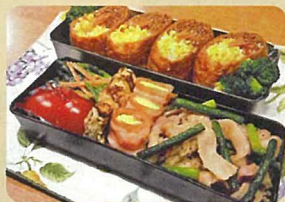
北条 海斗 「色どりもきれいなスタミナ満点弁当」