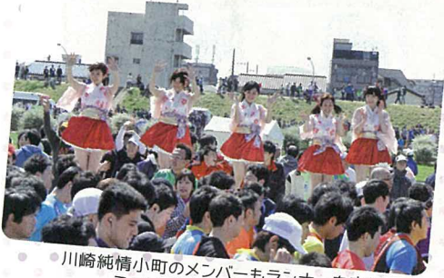
川崎純情小町のメンバーもランナーを応援 ミニライブも開催されました