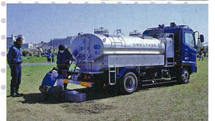
大会は多くのボランティアと関係者で運営されました (上) 救急ボランティア (中) 川崎市消防局 (下) 川崎市上下水道局