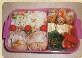
鈴木 真菜 「野菜たっぷりスタミナ弁当」