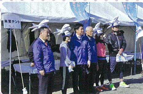
友好都市「島根県益田市」からも参戦