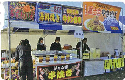
会場にはさまざまな屋台や企業ブースが並び お祭りのような賑わいでした