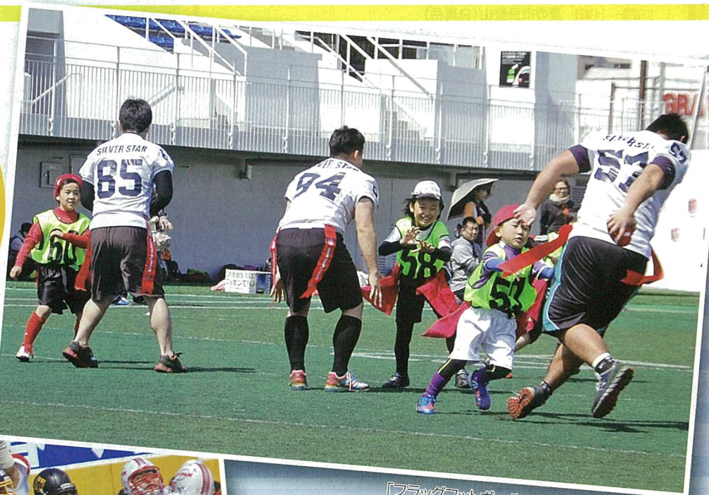
「フラッグフットボール・シルバースター交流会」