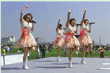
川崎純情小町の ライブ