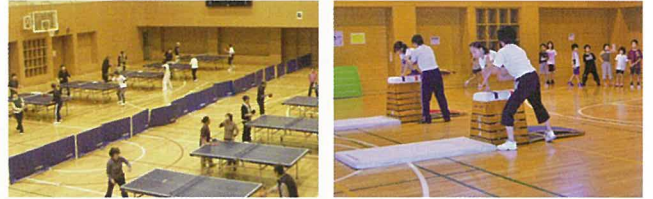
写真上: 外観 ・夏季はゴーヤのカーテンで窓を覆います 写真左: スポーツ教室(卓球) 写真右: スポーツ教室(小学生体操)