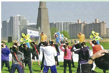
スタート前に エアロビクスで 準備運動