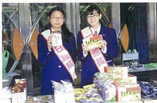
アリーナ1日館長も東北物産展でお手伝い

第3回アリーナまつりが3月14日(土)に開催されました。今年新たに設けられたのは、「伝承遊び」のコーナーで、近隣の老人会から講師としておいでいただいたみなさんの得意な「けん玉」、「折り紙」、「お手玉」教室が行われました。各コーナーには親子での参加も多く、講師の熟達した技術と手さばきに感嘆の声をあげていました。