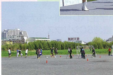
アンプティサッカーやニュースポーツが 体験できるコーナーも