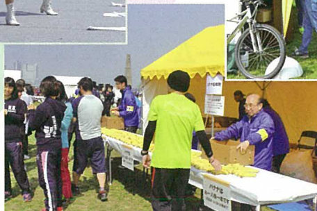
かわさき応援バナナで ランナーを応援