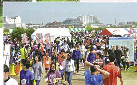
会場には屋台や企業ブースが立ち並び 縁日のようににぎわいでした