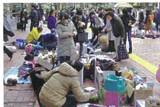
フリーマーケットも大盛況