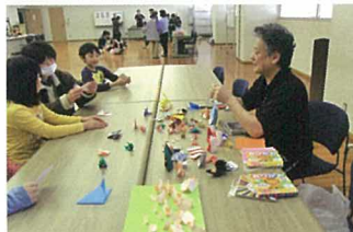
「伝承遊び」コーナー