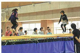
人気のトランポリン体験コーナー