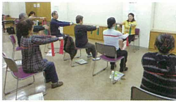
介護予防教室(委託事業)

季節の花とスタッフの元気なあいさつで皆さんをお迎えする当館は、平成18年4月に開館し9年目になります。あらゆる世代の方々が気軽に足を運び、運動に親しんでいただける快適な施設づくりに努めています。高齢社会が加速するいま、健康寿命延伸のための取り組みが各所でされています。当館でも健康体操教室等を通年実施し、さらに運動習慣のない方や低体力の方でも参加しやすいプログラムを用意しております。だれもが願う「心豊かで充実した生活」の一助となるよう、工夫を重ねてまいります。