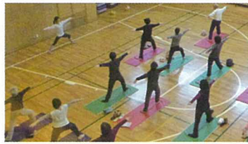
スポーツ教室(パワーヨガ)