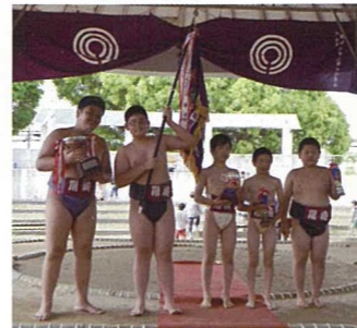
団体の部 優勝チーム

5月6日(水・祝)、川崎市宮富士見相撲場で第59回川崎市こども相撲大会が開催され、市内の小学生男女、団体8チーム、個人83名が参加し、元気いっぱいに相撲をとりました。今年も春日山部屋の力士が小学生力士と交流しました。