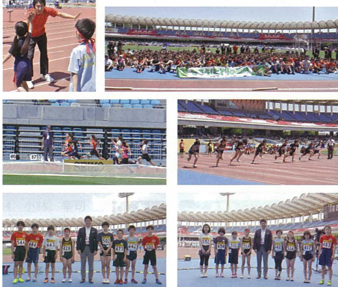
かわさきキッズ100mファイナルに出場した選手と福田紀彦川崎市長が記念撮影

100mの記録上位者は「かわさきキッズ100mファイナル」に出場し、世界のトップアスリートが見守るなか全力で走りました。