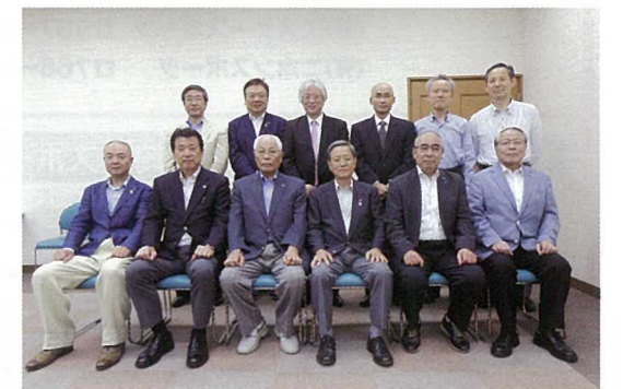
平成27・28年理事・監事のみなさま