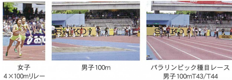
女子 4×100mリレー 男子100m パラリンピック種目レース 男子100mT43/T44

大会翌日の5月11日(月)、パラリンピック陸上競技選手4名が上丸子小学校を訪れ、障害者スポーツについて講演し、また実演しながら子どもたちと交流しました。