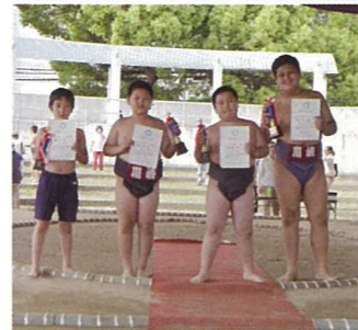
個人の部 優勝選手