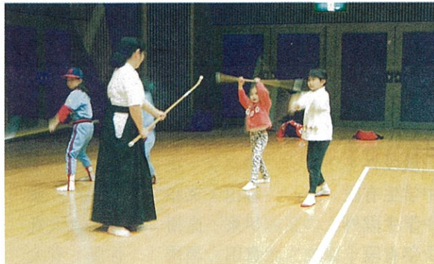
平成10年度 なぎなた教室より

川崎市スポーツ少年団本部主催、川崎市教育委員会、(財)川崎市体育協会、川崎市レクリエーション連盟が共催し、体育協会加盟の各団体が協力する「少年少女スポーツフェスティバル」が今年も、等々力緑地内のアリーナ、テニスコート、各グラ