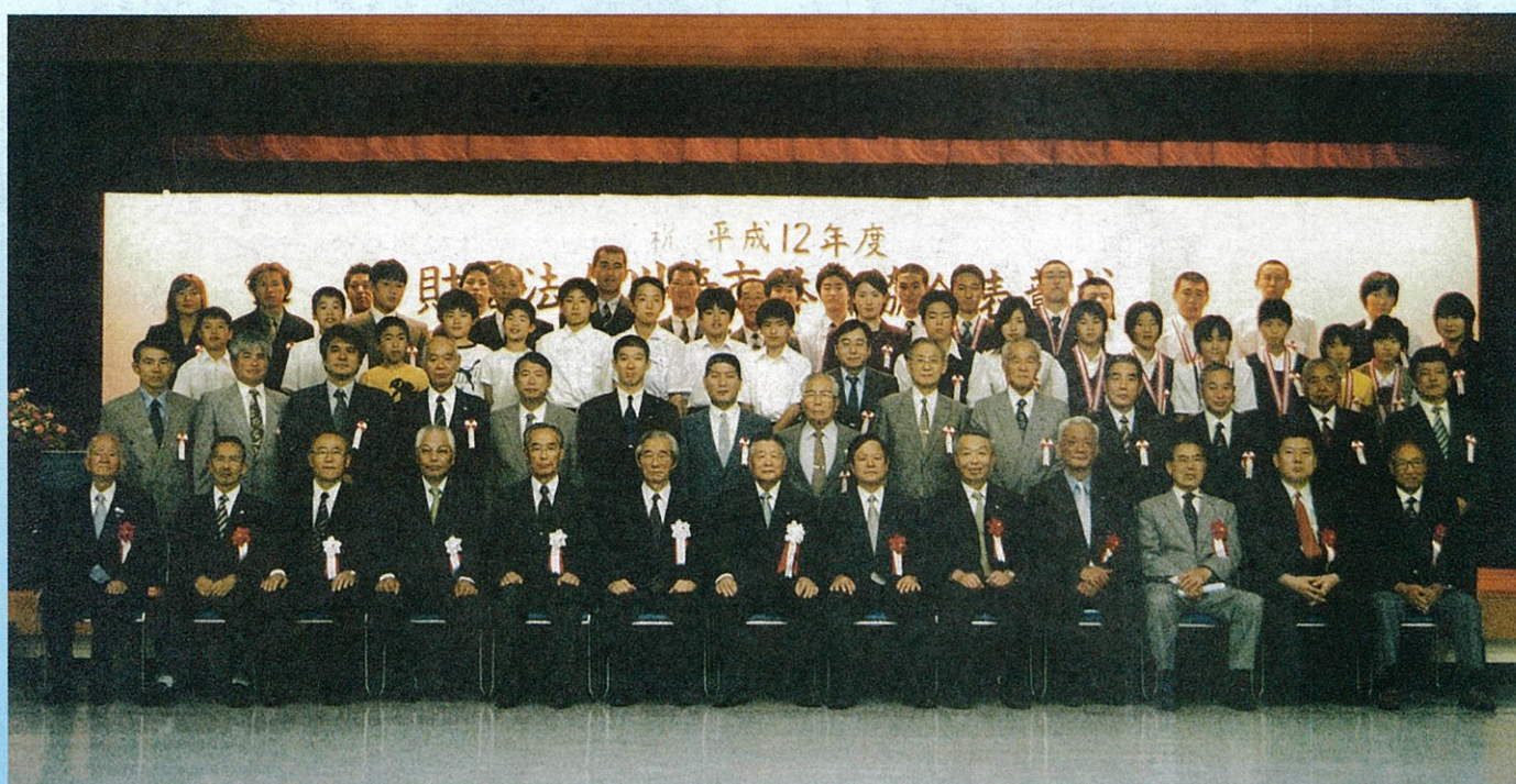
平成12年度（財）川崎市体育協会表彰式 受賞者、来賓、協会役員