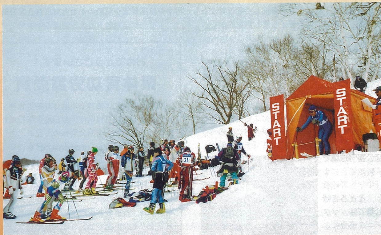
(第54回市民スキー大会より)