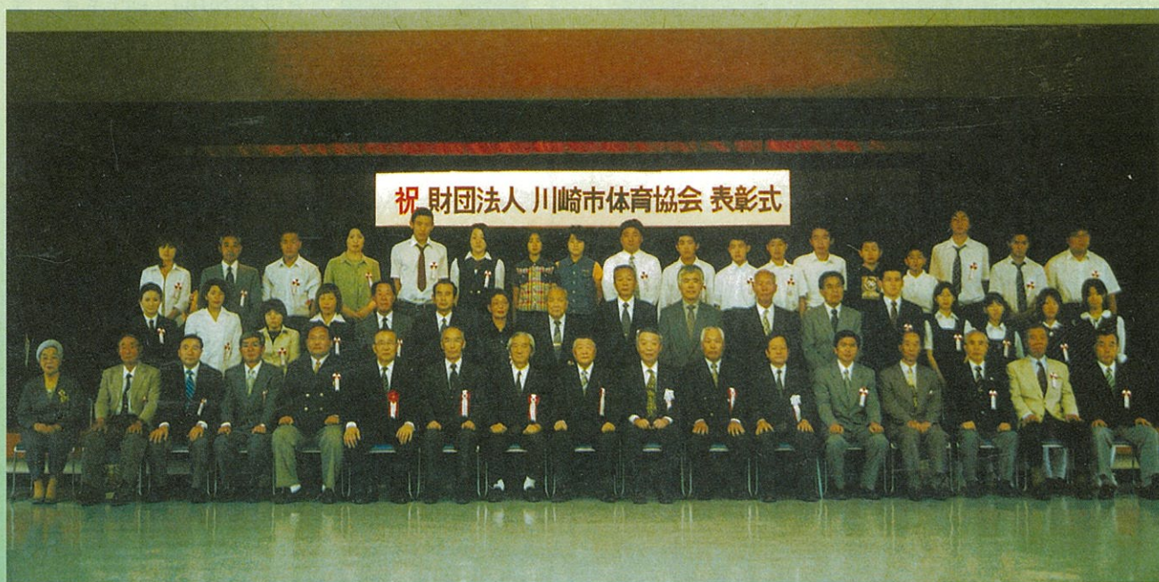
平成13年度 (財)川崎市体育協会表彰式 受賞者、来賓、協会役員