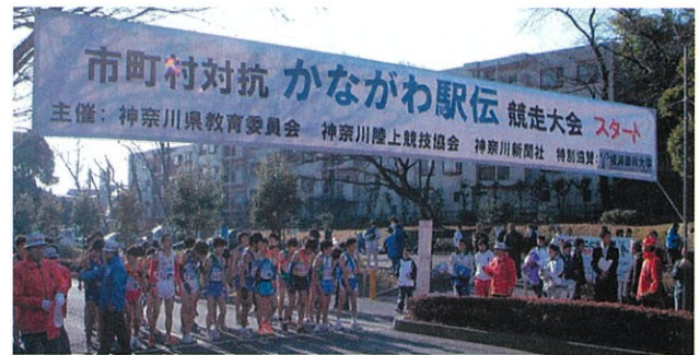
各市町村代表ランナーのスタート前の様子

2月8日(日)30市町村が参加して7区間51.5kmのコースを競い合い、川崎市が見事優勝の栄冠に輝きました。今年のメンバーはいずれも川崎育ちという生粋の「川崎代表選手」で、今までに体育協会が指導者派遣やクラブチームへのサポートを行い、ジュニアからの選手育成・強化策が実を結んだ成果とも言えます。