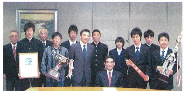
川崎市代表選手の市長表敬訪問