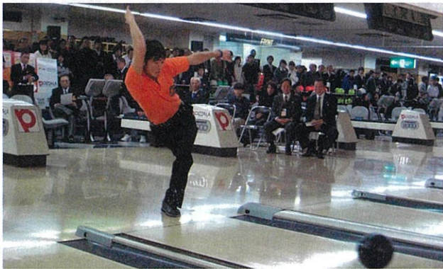
会場が沸いた決勝トーナメント

優勝 福岡第一高校 (福岡県) 青森工業高校 (青森県) 準優勝 藤井寺工科高校 (大阪府) 横浜南陵高校 (神奈川県) 第3位 仙台育英高校 (宮城県) 如水館高校 (広島県)