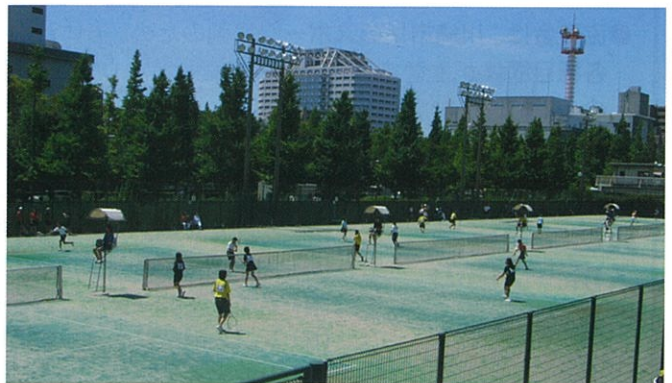
市制記念大会風景

川崎市ソフトテニス協会は、協会の体制ができてから60年を迎えようとしています。企業の選手が中心となり運営をしていました。その頃から川崎市は強く、市外大会においては優秀な成績を挙げていました。一時期は、日本トップクラスの実業団がある川口市と強化・交流を含め、年に1回川口市に出向き団体戦を行っていました。