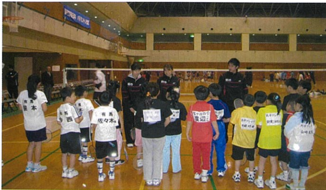
NTT 東日本チームによるジュニア指導会の様子