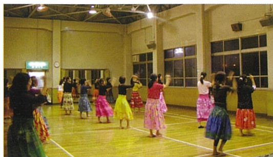
フラダンス教室(市体育館)

用対効果の向上」並びに「市民サービスの拡充」が達成できました。これからも引き続き次期指定管理事業受託に向けて努力していくとともに、142万川崎市民がますますスポーツに親しむ環境づくりに努めてまいります。