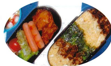
体育協会会長賞受賞作品