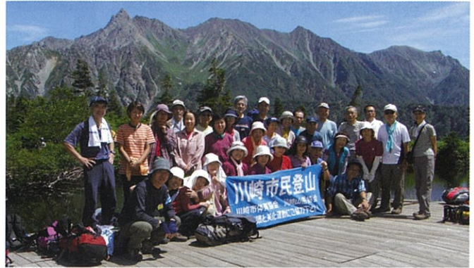
昨年度の市民登山（鏡平にて）

第10回国民体育大会神奈川大会開催を契機に、川崎スキー山岳協会が昭和29年6月10日にスキー協会と山岳協会に分離し、それぞれ独立して川崎市体育協会に加盟した時を川崎市山岳協会（当時の名前は「川崎山岳協会」）の設立日としています。昨年には、設立55周年として、記念式典の開催、記念誌の発刊、記念集中登山（会員による複数ルートからの登山）等の行事を行ないました。かつては30以上を数えた加盟団体も工場や事業所の川崎からの移転等もあり、現在は11団体（クラブ数6、事業所数5）にまで減ってしまい、人数は270名前後です。毎年度の協会員対象の事業としては、協会祭り、クライミング大会、夏山技術交流会、冬山技術交流会、事故防止対策協議会などがあり、技術の向上や遭難対策に努力しております。また、市民対象事業として（財）川崎市体育協会や市教育委員会（今年度から川崎市）の主催する春の市民ハイキング、市民春山登山、アルプスなどの市民夏山登山および市民秋山登山があり、山岳協会がこれらの行事を主管することにより、市民の体力向上や自然保護意識の涵養に貢献しています。