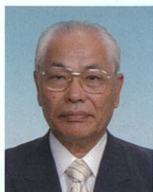
(財)川崎市体育協会 会長あいさつ