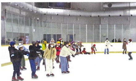
初めて・初心者クラス

公益財団法人川崎市スポーツ協会 月～金曜日 8:30～17:00 (FAX24時間可)